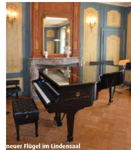
neuer Flügel im Lindensaal

Auswahl des Instruments wurde eine Arbeitsgruppe, bestehend aus drei Klavierlehrpersonen der MSRT, betraut. Am Ende des Evaluationsverfahrens fiel die Wahl auf das Modell B-211 aus dem Hause Steinway&Sons mit Baujahr 2012. Kurz vor den Weihnachtsferien durften wir das wunderbare Instrument, direkt aus dem Stammhaus in Hamburg kommend, bei uns in Empfang nehmen. Die offizielle Einweihung mit Gönner Apéro, Konzert und Einweihung der Gönner tafel findet im folgenden Berichtsjahr statt.