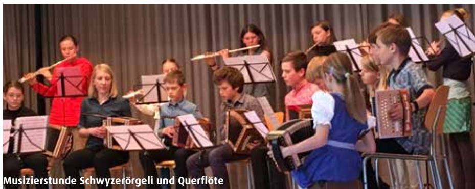
Musizierstunde Schwyzerörgeli und Querflöte