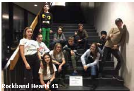
Rockband Hearts 43

Sieben Bands traten am Freitagabend, 1. Februar mit grossen Ambitionen am Bandcontest auf. Das Gymnasium Thun veranstaltete zum zweiten Mal einen Bandwettbewerb, für den sich Bands der 7. - 9. Klasse qualifizieren konnten. Die Rockband des Schulhauses Längenstein Spiez, Hearts 43 , mit u.a. 6 Schülerinnen und Schülern der MSRT, gewann am Bandcontest im Gymnasium Thun den ersten Preis: 2 Aufnahme-Tage in einem professionellen Tonstudio im Wert von 1000 Franken.