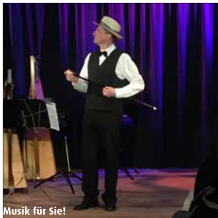
Musik für Sie!

Mit einem Apéro klang der gelungene Abend im schönen Ambiente der Fundusbühne an der Marktgasse in Thun aus.