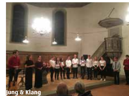
Jung & Klang

von Jung & Klang sei herzlich für ihr Engagement für die MSRT gedankt.