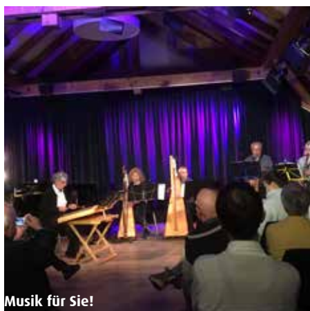
Musik für Sie!