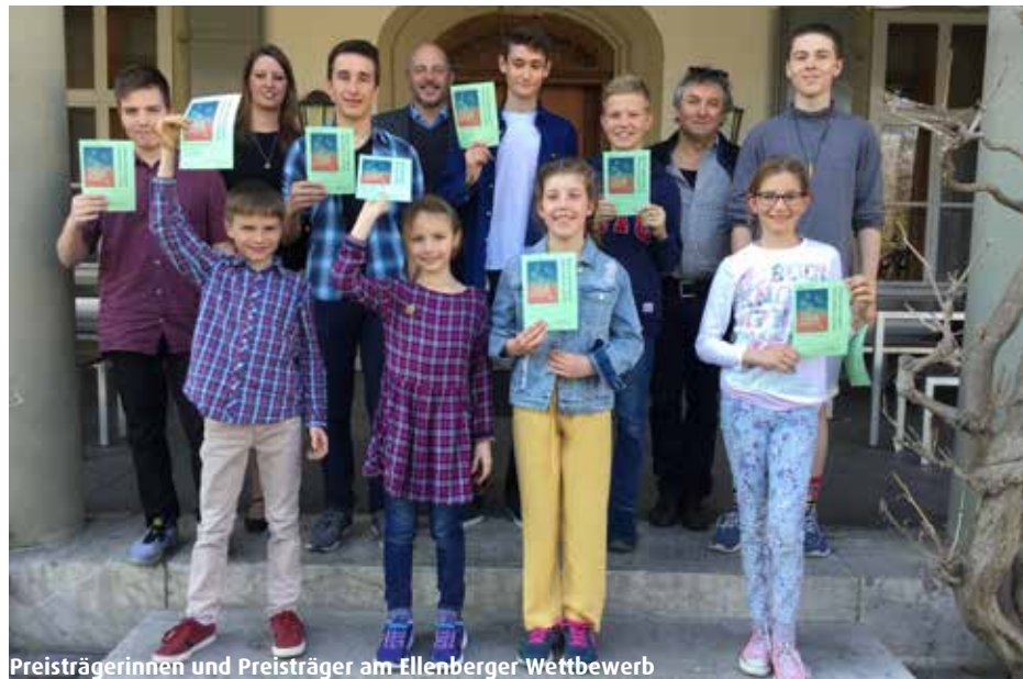
Preisträgerinnen und Preisträger am Ellenberger Wettbewerb