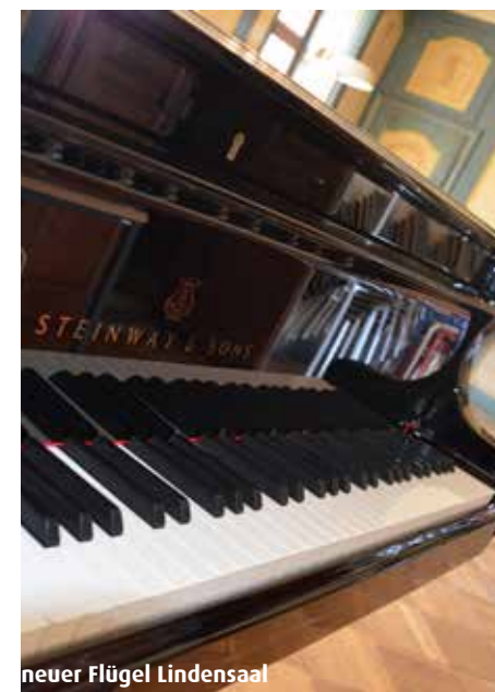
neuer Flügel Lindensaal

- Zu Gunsten des neu anzuschaffenden Flügels durfte die MSRT weitere Spenden entgegennehmen (s. auch Seite 5)