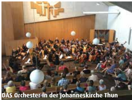
DAS Orchester in der Johanneskirche Thun