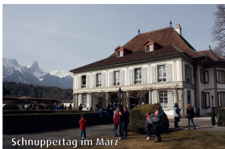
Schnuppertag im März

von Instrumenten und fröhlichem Betrieb im Musikschulhaus. Auf Anmeldung erhielten die Familien ein Zeitfenster für einen Rundgang durch die Welt der Instrumente. Durch die pro Zeitfenster beschränkte Teilnehmerzahl entstanden wertvolle Kontakte, und sowohl Lehrpersonen wie Eltern und Kinder konnten sich in Ruhe den Abklärungen und dem Annähern an die verschiedenen Instrumente widmen.