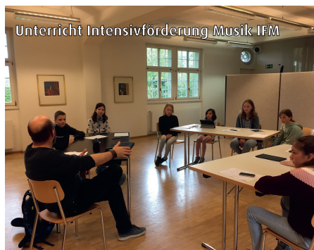
Unterricht Intensivförderung Musik IFM

Die Talentförderung ist ab 2022 im Volksschulgesetz sowie im Sportförderungsgesetz verankert. Der Kanton Bern will die Talentförderung im sportlichen und im musischen Bereich (Musik, Tanz und Gestalten) stärken. Aus diesem Grund vergab eine kantonale Fachkommission zum ersten Mal Talentkarten. Mit einer Talentkarte können Schülerinnen und Schüler (auch an einer Schule ohne Förderprogramm) regelmässige oder umfangreiche schulische Dispensationen beantragen. 24 Schülerinnen und Schüler der drei Musikschulen Oberland Ost (MSO), unteres Simmental/Kandertal (MUSIKA) und der MSRT haben diese Karte beantragt.